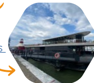
la Barge du Crous de Paris