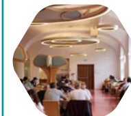
la Cité internationale