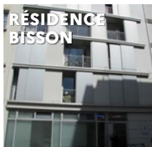
RÉSIDENCE BISSON 21 rue Bisson 75020 Paris