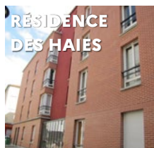
RÉSIDENCE DES HAIES 72-74 rue des Haies 75020 Paris