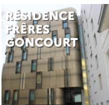
RÉSIDENCE FRÈRES GONCOURT 117 rue de Ménil- montant 75020 Paris