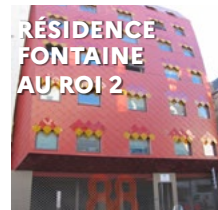
RÉSIDENCE FONTAINE AU ROI 2 88-90 rue de la Fon- taine au Roi 75011 Paris