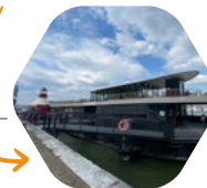
la Barge du Crous de Paris