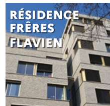
RÉSIDENCE FRÈRES FLAVIEN 23/25 rue des Frères Flavien, 75020 Paris