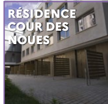
RÉSIDENCE COUR DES NOUES 4bis-6 rue de la Cour des Noues, 75020 Paris