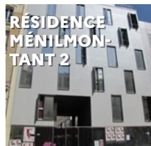
RÉSIDENCE MÉNILMON- TANT 2 109-111 rue de Ménil- montant 75020 Paris