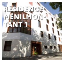
RÉSIDENCE MÉNILMON- TANT 1 124-130 bd de Ménil- montant, 75020 Paris