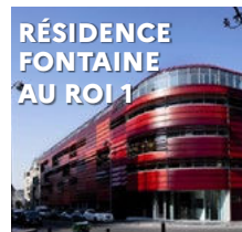
RÉSIDENCE FONTAINE AU ROI 1 91-95 rue de la Fon- taine au Roi 75011 Paris