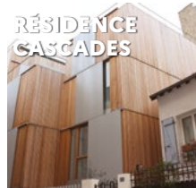
RÉSIDENCE CASCADES 52 rue des Cascades 75020 Paris