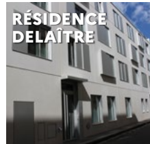
RÉSIDENCE DELAITRE 9 rue Delaitre 75020 Paris